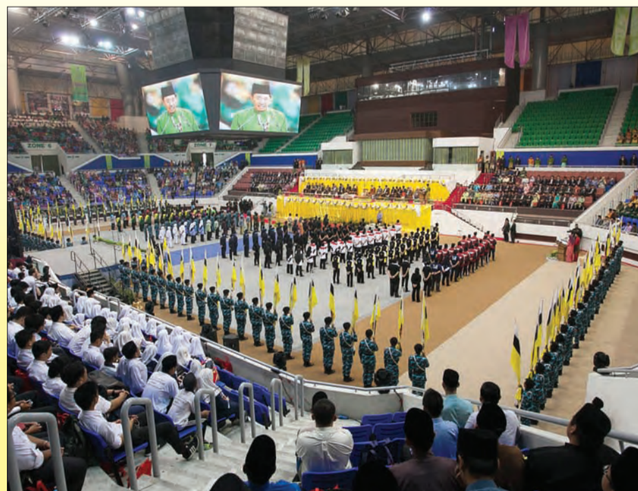
SAMBUTAN Hari Belia Kebangsaan Ke-8 diserikan dengan persembahan 'Belia Menuju Wawasan' oleh lebih 100 belia terdiri dari para pelajar, Persatuan Belia, Kadet Tentera, Kadet Polis, Program Khidmat Bakti Negara, Kadet Bomba dan pelajar dari Pendidikan Teknik dan Vokasional.