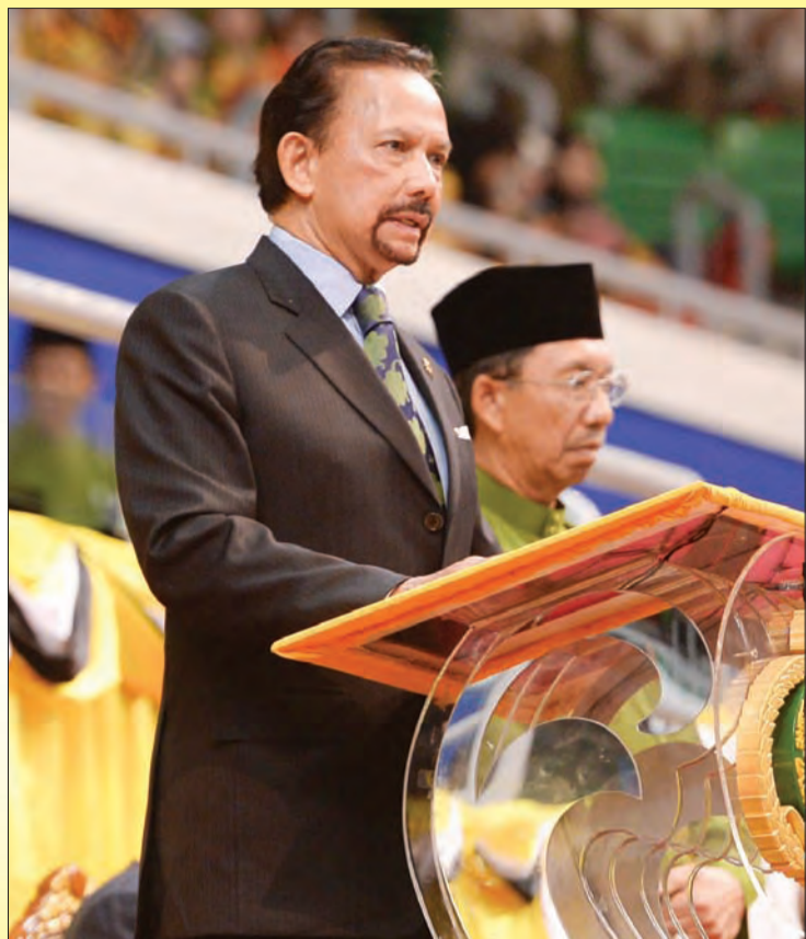
KEBAWAH Duli Yang Maha Mulia Paduka Seri Baginda Sultan Haji Hassanal Bolkiah Mu'izzaddin Waddaulah ibni Al-Marhum Sultan Haji Omar 'Ali Saifuddin Sa'adul Khairi Waddien, Sultan dan Yang Di-Pertuan Negara Brunei Darussalam berkenan mengurniakan titah pada sambutan Hari Belia Kebangsaan Kali Ke-8.