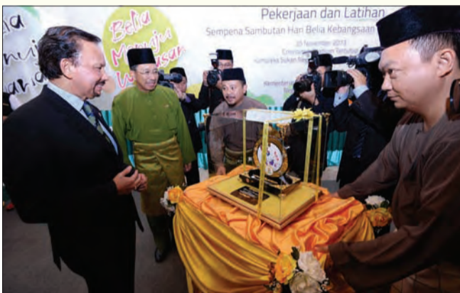
KEBAWAH Duli Yang Maha Mulia berkenan menerima pasambah.