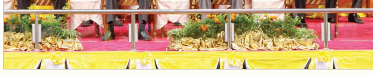
BERANGKAT sama Duli Yang Teramat Mulia Paduka Seri Pengiran Muda Mahkota Pengiran Muda Haji Al-Muhtadee Billah ibni Kebawah Duli Yang Maha Mulia Paduka Seri Baginda Sultan Haji Hassanal Bolkiah Mu'izzaddin Waddaulah, Menteri Kanan di Jabatan Perdana Menteri, Duli Yang Teramat Mulia Paduka Seri Pengiran Perdana Wazir Sahibul Himmah Wal-Waqar Pengiran Muda Mohamed Bolkiah, Menteri Hal Ehwal Luar Negeri dan Perdagangan, Duli Yang Teramat Mulia Paduka Seri Pengiran Bendahara Seri Maharaja Permaisura Pengiran Muda Haji Sufri Bolkiah dan Yang Teramat Mulia Paduka Seri Duli Pengiran Muda 'Abdul Malik.